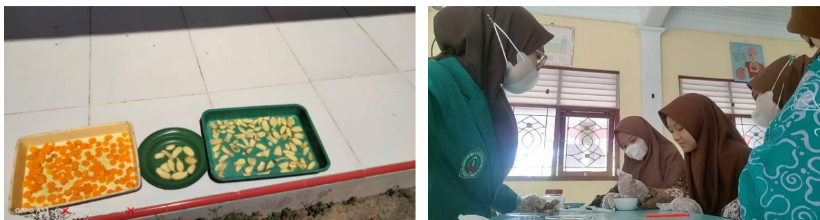
Gambar 4. Praktik Pembuatan Simplisia

Pada tahap berikutnya kegiatan dilanjutkan dengan membimbing siswa praktik pembuatan simplisia dari tanaman obat melalui beberapa tahapan, yaitu persiapan bahan, sortasi basah, pencucian, perajangan, pengeringan, sortasi kering, penghalusan bahan, dan penyimpanan sediaan bahan herbal seperti yang nampak pada Gambar 4.