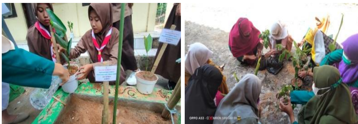
Gambar 3. Praktik Penanaman Tanaman Obat di Sekolah

Kegiatan dilanjutkan dengan menanam bersama tanaman obat untuk membuat taman tanaman obat di sekolah. Ada 7 jenis tanaman obat yang ditanam di MA Nurul Ulum Teja Barat Pamekasan, 6 jenis tanaman obat di SMA Bustanul Mubtadiin Pangorayan Proppo Pamekasan, dan 3 jenis tanaman obat di MA Mambaul Ulum Sumber Moni Poreh Karang Penang, Sampang. Kegiatan ini nampak pada Gambar 3.