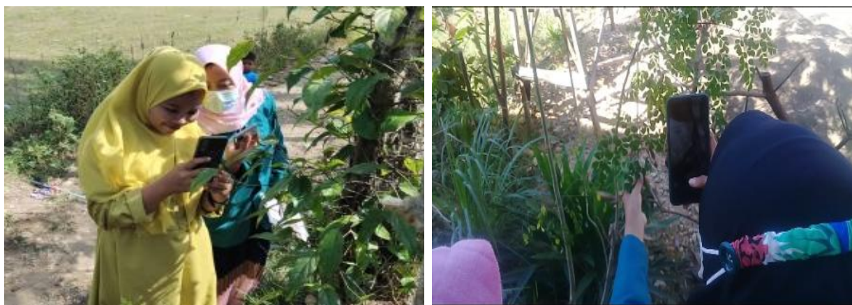
Gambar 2. Praktik Identifikasi Tanaman Obat Berbantuan Aplikasi Google Lens

Kegiatan diawali dengan pengisian kuesioner oleh siswa yang mengukur pengetahuan siswa terkait tanaman obat meliputi: jenis-jenis tanaman obat yang diketahui, identifikasi tanaman herbal dan cara pembuatan simplisia dari tanaman obat. Selanjutnya siswa mendapat penjelasan materi oleh tim pengabdian dalam bentuk presentasi mengenai tanaman obat yang dijumpai di sekitar sekolah. Setelah materi dipaparkan dilaksanakan praktik identifikasi tanaman obat menggunakan via google lens dengan memanfaatkan jenis-jenis tanaman obat yang sudah dijelaskan seperti pada Gambar 2.