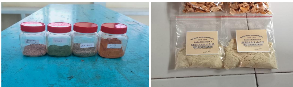
Gambar 5. Hasil Praktik Pembuatan Sediaan Herbal

Kegiatan dilanjutkan dengan mengolah atau memanfaatkan tanaman herbal yang ada di lingkungan sekitar sekolah untuk membuat jamu tradisional yang dapat di gunakan untuk obat herbal. Siswa di ajarkan cara membuat jamu yang baik dan benar sesuai dengan Cara Pembuatan Obat yang Baik (CPOB). Penerapan CPOB mencakup seluruh aspek produksi, mulai dari fasilitas, personel, peralatan, hingga pengendalian mutu untuk memastikan produk yang dihasilkan konsisten dan sesuai dengan tujuan penggunaannya (Saptaningtyas & Indrahti, 2020). Jamu yang dibuat adalah jamu herbal yang mempunyai khasiat untuk menjaga imunitas tubuh. Bahan yang digunakan yaitu temulawak, jahe, dan kelor. Kandungan senyawa aktif yang ada pada tanaman herbal tersebut dapat meningkatkan imunitas tubuh agar tidak mudah terserang penyakit (Agustina et al., 2022; Munisih et al., 2021). Kegiatan ini nampak pada Gambar 5.